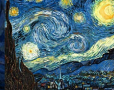
OBRA DE VINCENT VAN GOGH